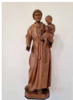
► Haus St. Antonius, Rottweil re.: Hl. Antonius