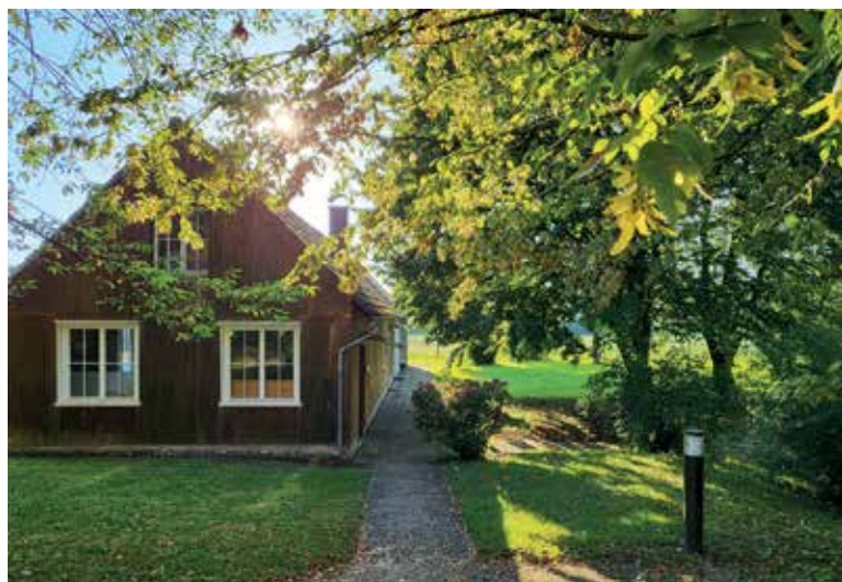
➤ Garten Eriskirch/Moos