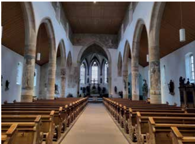
► Kirche St. Moriz

Am Sonntag, den 23. Juni 2024 findet die Veranstaltung „Begegnung ohne Grenzen“ in Rottenburg statt. Der Auftakt ist um 10:30 Uhr mit einem ökumenischen Gottesdienst in der St. Moriz Kirche. Dieser wird in die Gebärdensprache übersetzt und vom Gebärdenchor mitgestaltet. Im Anschluss an den Gottesdienst findet ein buntes Programm mit Spiel, Kultur und Unterhaltung auf dem Gelände bei der Morizkirche statt. Begegnung ohne Grenzen – ein Tag der Gemeinschaft für alle Menschen. Herzliche Einladung.